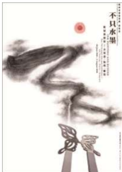
靳埭强个展招贴设计“不只水墨” 中的红点即有印章的意向

金石印章通常采用篆书字体，在方寸之间融合了书法、章法、刀法、文化、意境、赏石等的精髓，金石印章适合于一些强调中国风的广告设计作品运用，也可以作为标志设计、标题文字设计或者点缀元素运用在局部设计中。