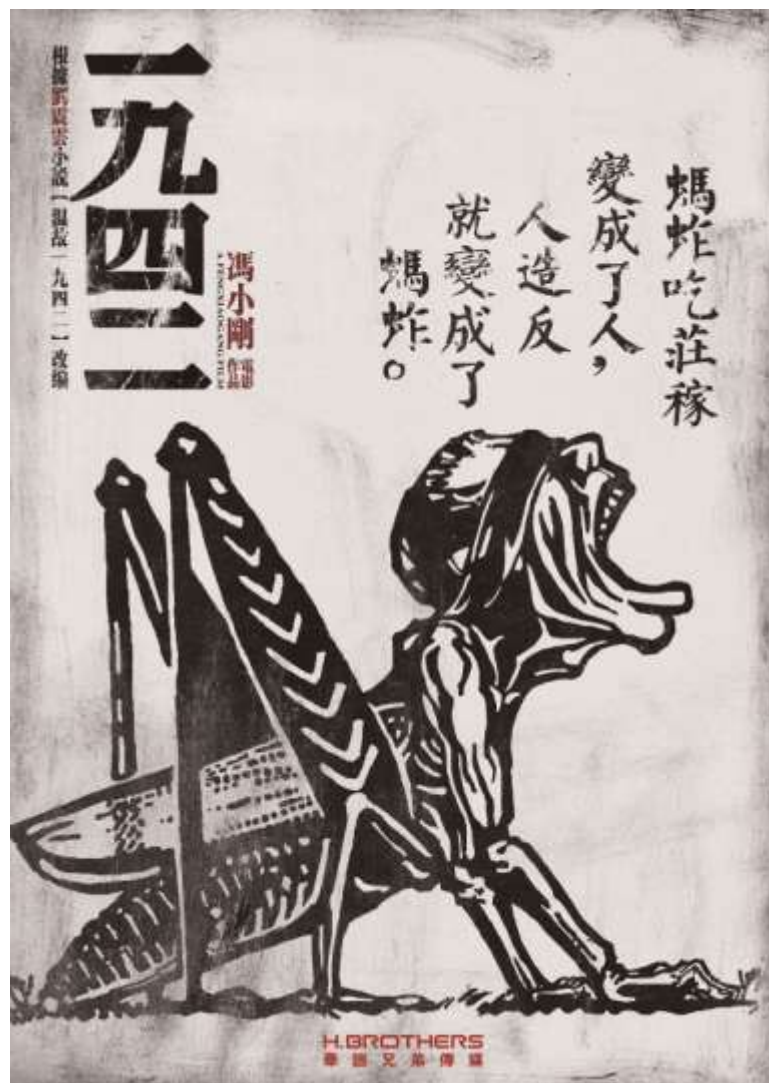
冯小刚导演的电影《一九四二》的电影招贴就采用了木刻版画的表現手法