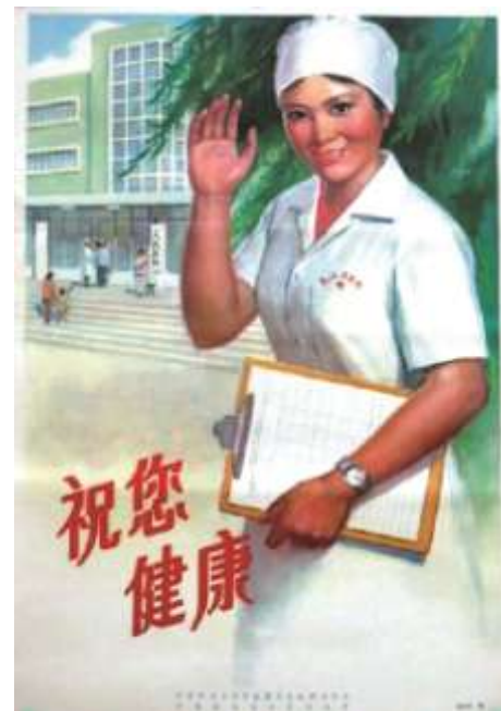
20世纪70年代“祝您健康”卫生宣传画采用水粉画的表现手法