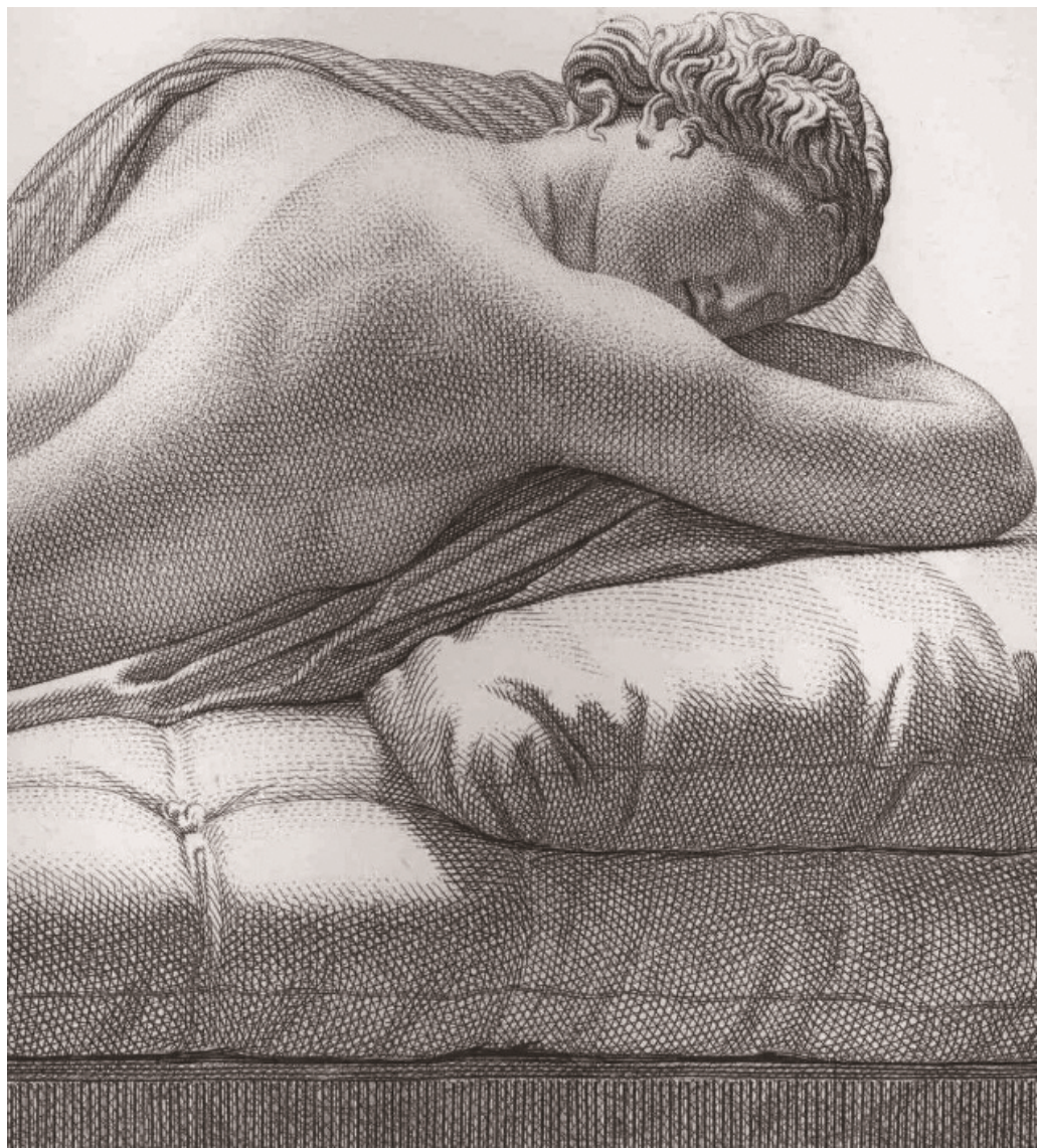
19世纪初铜版画作品 “Hermaphrodite” 的局部细节