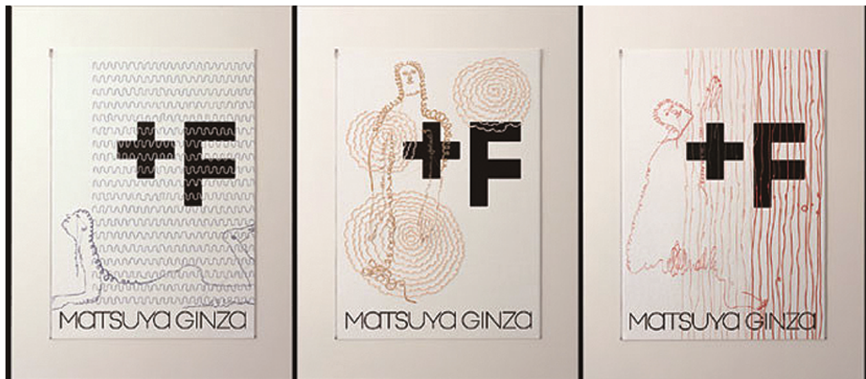
原研哉为日本松屋百货（MATSUYA GINZA）设计的招贴就采用了机器刺绣的表现手法

刺绣是指利用针等工具以及棉线、丝线、纱线等纤维材料在各种面料的织物上通过刺绣的方式进行图案、花纹、图像等绘制的装饰艺术。刺绣根据技法可以分为乱针绣、错针绣、满地绣、盘金、铺绒、戳纱、锁丝、洒线、挑花等；根据地域可以分为苏绣、湘绣、蜀绣和粤绣等。刺绣是中国民间传统手工艺之一，属于民间艺术范畴，题材多样，多与绘画、传统符号等相结合。