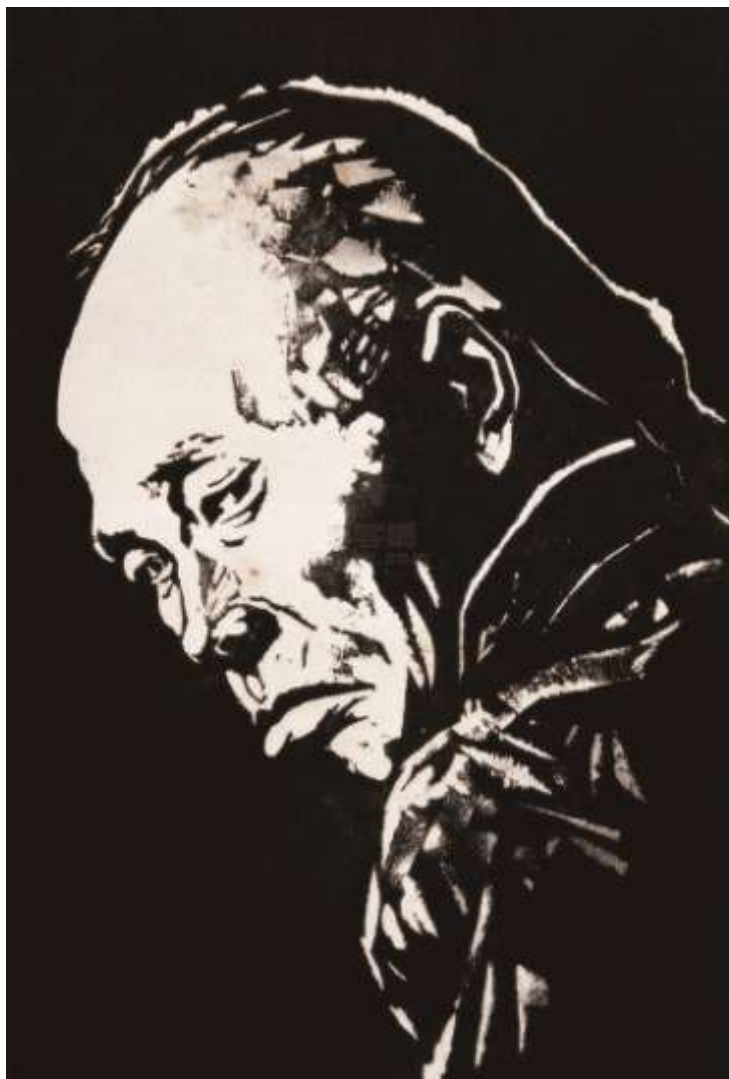
中国版画家赵延年的黑白木刻版画插图作品“阿Q正传”之一，1978年