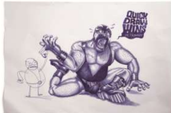
Pictionary看图识字玩具产品系列广告设计，“Quick Draw Wins”的主题就是通过铅笔画与圆珠笔画的插图表现，获得2011戛纳广告节平面类金奖 设计：奥美马来西亚，插图：Milx