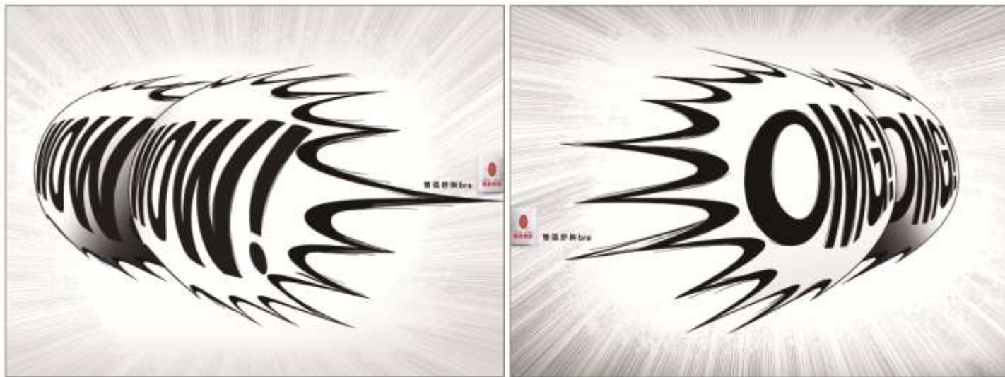
曼黛玛琏文胸“双弧舒胸”系列广告，利用叹词文字与文胸图形相结合的方式创意表现

通过文字的设计来表现广告的创意是另一种独特的表现手法，主要包括字体本身的图形化设计和文字组合的图形化设计的表现方法，以上方法都要综合考虑文案的内容与品牌定位以及广告设计的风格倾向。