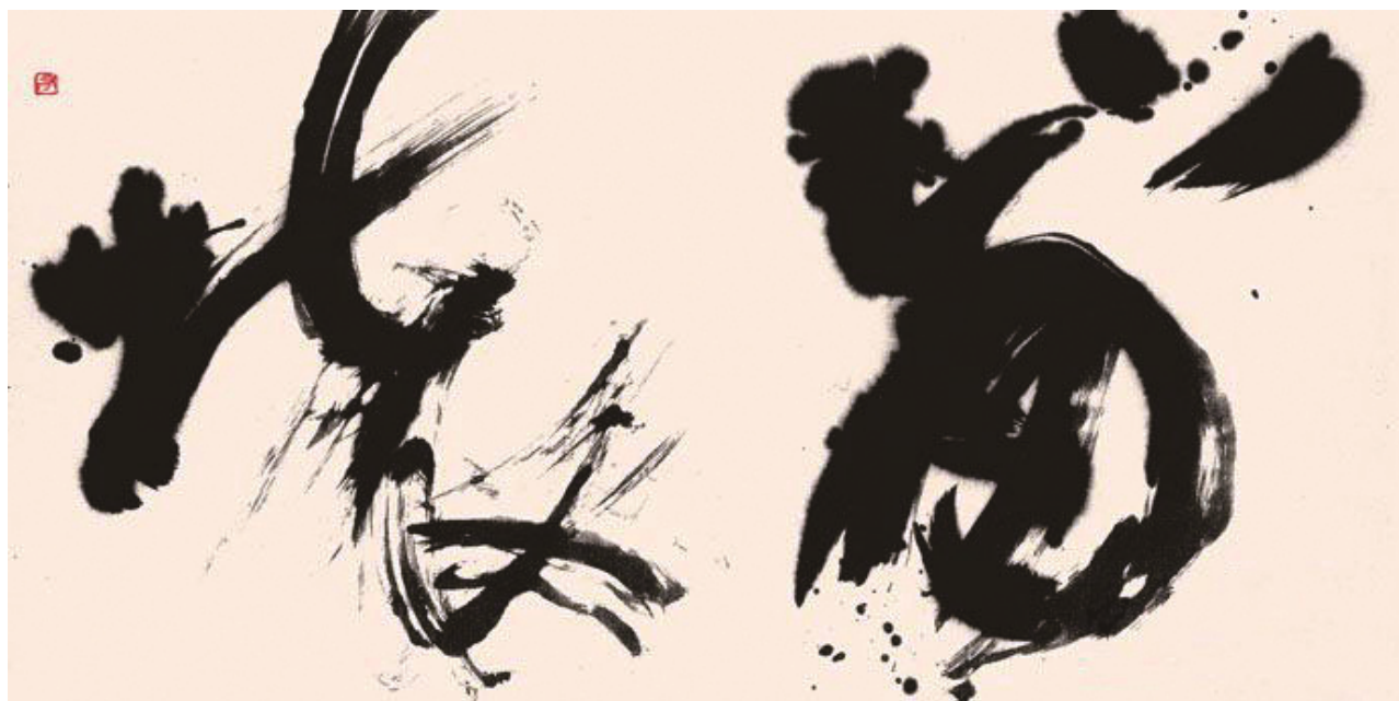
日本现代书法家手岛右卿的书法作品“崩坏”，1957年

现代书法是和传统书法相对而言，在字体结构、用笔笔触、创作观念、艺术风格等方面逆反的一种字体书写艺术化表现形式。传统书法重视文字的识别度，现代书法重视文字的艺术化。