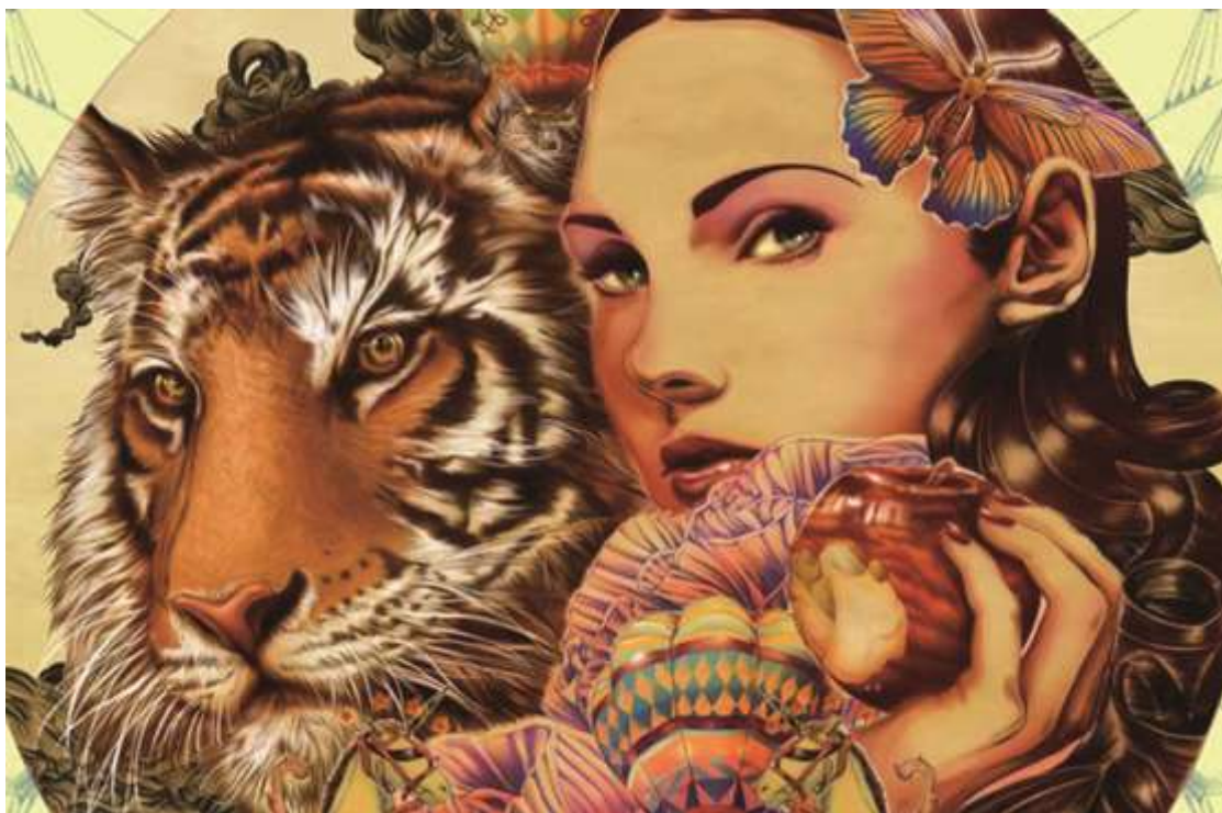
泰国插画师Ise Ananphada的插画作品， 采用Painter进行创作