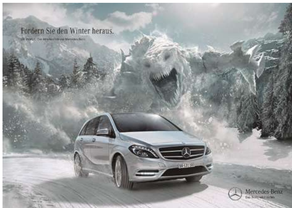
奔驰G级汽车广告“无惧雪路”采用Photoshop处理广告创意图像

Photoshop软件也可以与其他图像、图形软件结合使用，常作为广告创意图像的创作首选。