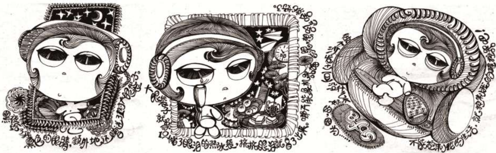
采用水笔手绘的“大眼袋子”系列插画设计，设计：段嵘

钢笔画指利用钢笔、纸等作为工具、材料进行的绘画创作，包含圆珠笔、水笔、马克笔等与钢笔笔触接近的工具。钢笔、圆珠笔、马克笔所具有的特殊笔触能带来特别的画面效果。例如，一些主题表现校园生活、学生学习情境的广告设计；地下乐队的演出招贴设计等可以采用钢笔画这种表现形式，贴合主题的同时也带来自由、随性、不羁的画面。