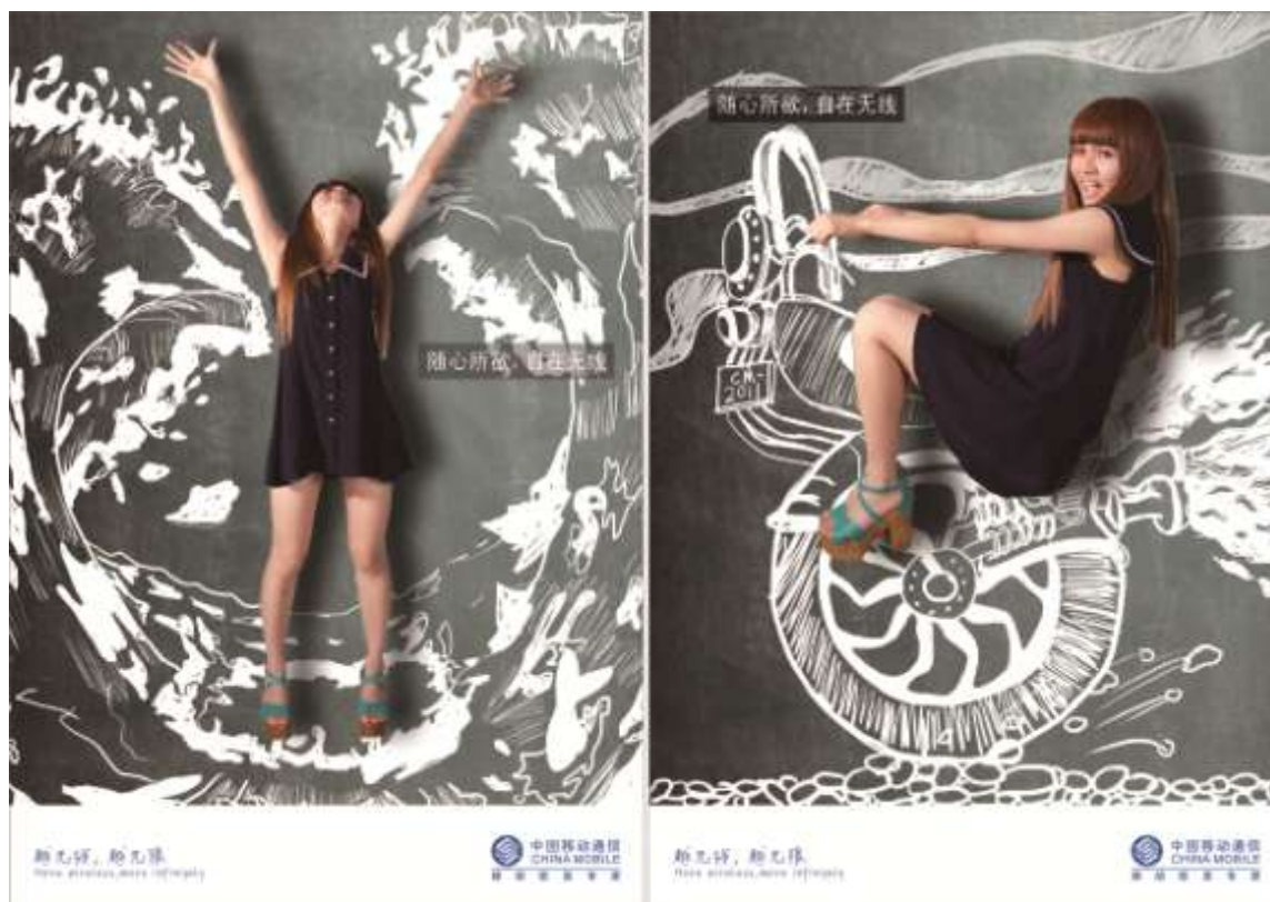
中国移动通信系列广告海浪篇、摩托篇采用摄影与插画结合的表现手法，设计：郭姝青，指导：刘洁

摄影与插画结合的方式在广告设计中方兴未艾，摄影与插画结合的方式兼具有摄影直观、丰富、层次、再现的特点与插画表现方式多样性的特点，两者的结合相得益彰，呈现出亦真亦幻、超现实的画面。