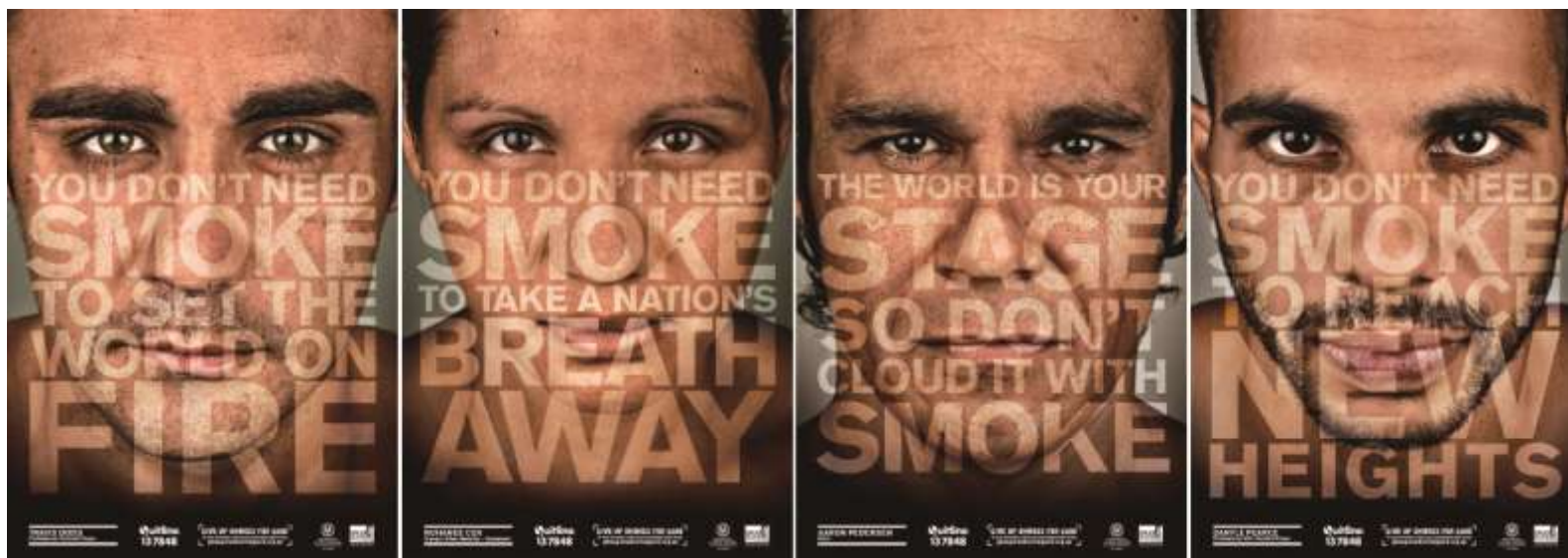
Drug & Alcohol Services South Australia的控烟主题系列广告采用摄影表现手法，人像特写摄影真实再现，细节清晰