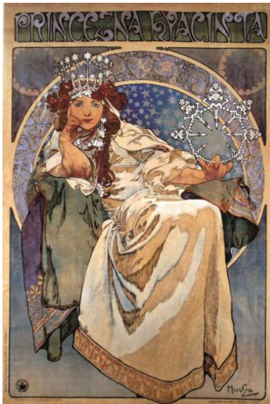
捷克版画家米夏的石版广告画作品