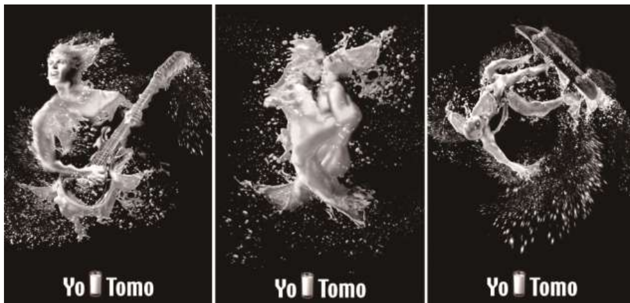
智利Promolac牛奶系列广告采用了非常艺术化的表现手法来传达广告“牛奶的激情”的主题

广告设计表现手法定位是基于艺术表现手法应运而生的。面对浩瀚如斯的各种艺术表现手法，广告设计只有潜心学习。通过学习、熟悉、掌握各种艺术表现手法，在设计作品中——尝试来完成合适的广告设计表现手法定位执行。