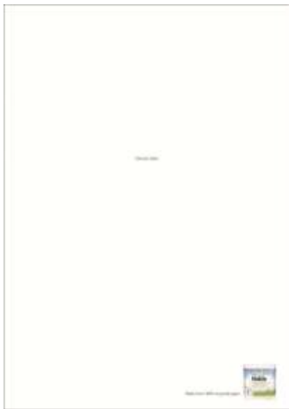
Hakle卫生纸广告 “See you later , Made from 100% recycled paper” , 2011戛纳广告节平面类银奖, 设计: JWT+H+F, 瑞士, 文案: Mathias Bart