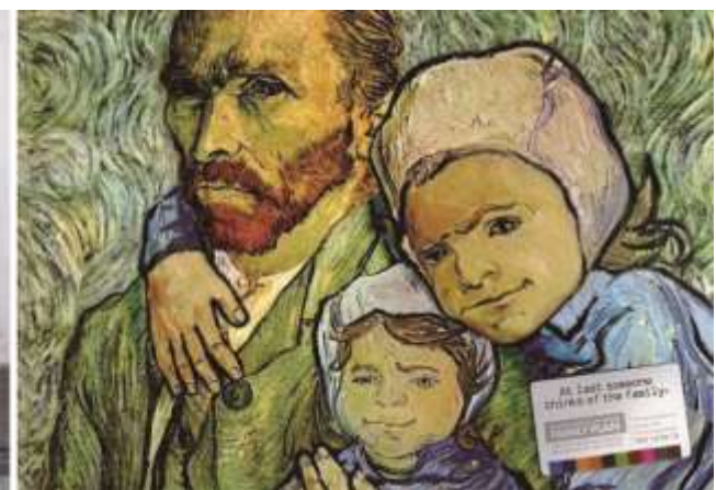
金融机构家庭计划系列广告 “At last someone thinks of the family” 的插图采用丙烯、涂鸦、油画多种绘画表现手法