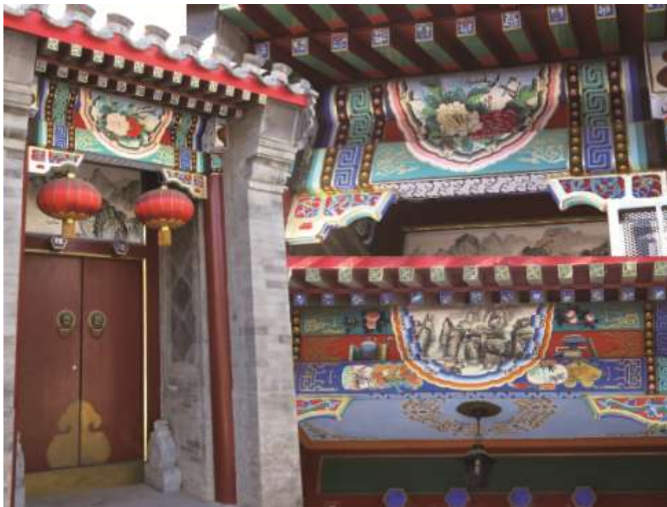
北京传统民居的 彩绘门头

彩绘是指利用天然植物、矿物颜料在建筑物内外、局部等进行绘制的装饰艺术。作为一种古老的民间艺术，彩绘常出现于中国传统建筑的栋梁枋拱、屋顶藻井、灶头门窗、墙壁栏杆、雀替、椽子等局部建筑构件中，也出现在泥塑等民间工艺品的绘制加工中。