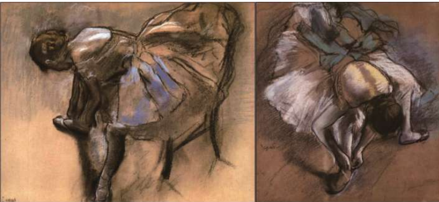
19世纪法国印象派画家德加的舞娘系列色粉画作品