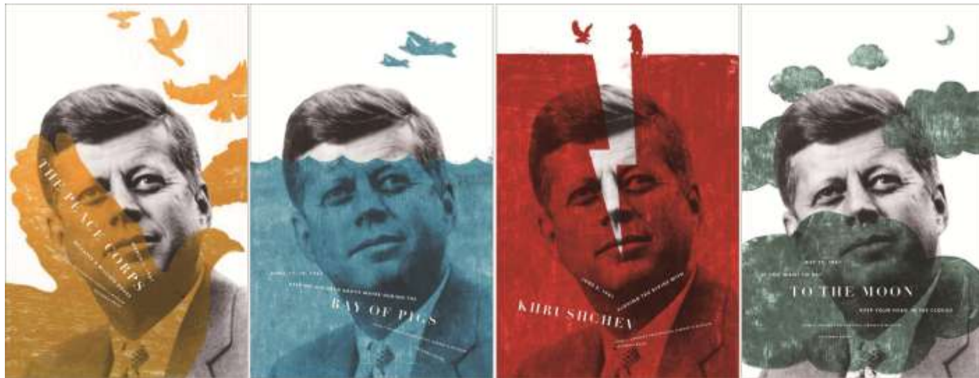
The JFK Presidential Library and Museum系列广告设计， 采用了丝网版画的表現手法

丝网版画目前在商业广告上得到较多的运用，丝网版画有立体触感、色彩艳丽、灵活快捷，通常用在平面广告、外包装、赠品T恤等广告载体上。