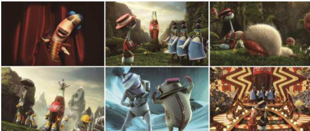
微软与可口可乐广告合作的Windows7 “The Great Happification” 主题广告采用3D动画效果

Maya是一款为影视特效、影视广告、角色动画等专业开发的高端三维动画软件，具有强大的3D建模、动画、特效和真实感很强的渲染功能。Maya也被广泛运用到了平面广告设计中，其强大的特效能够帮助设计元素的三维立体呈现，增进了广告设计的视觉效果，呈现得更为立体化。